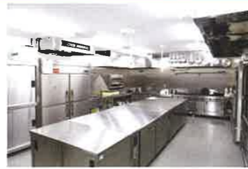
給食センター・厨房